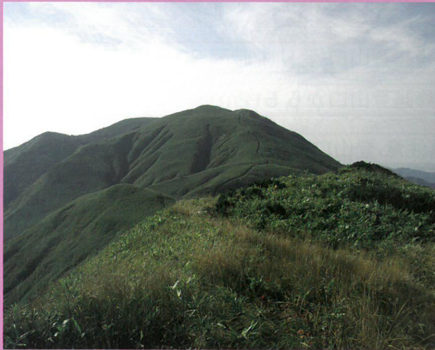
音動岳から真昼岳